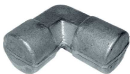
Forjado Cotovelo Curto Inox 90° AZ 09