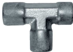
Forjado Tee AZ 10