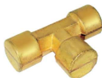
Forjado Tee AZ 02