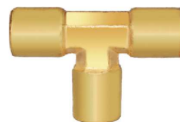
Forjado Tee AZ 03