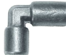
Forjado Cotovelo 90° AZ 12