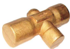
Forjado Válvula AZ 01

Forjados em Latão, Aço Inox 316, Aço Carbono e Alumínio.