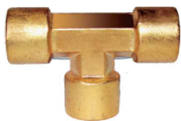
Forjado Tee AZ 04