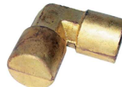
Forjado Cotovelo 90° AZ 06