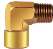
Cotovelo M/F 90° – AZ 508-A