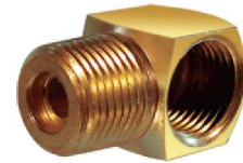
Cotovelo Curto M/F 90° – AZ 506-A